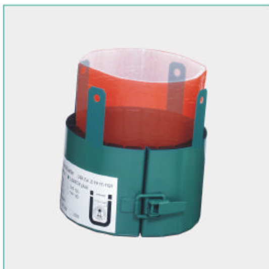
DIBT Zulassung Z-19.17-1191, R90 nach DIN 4102